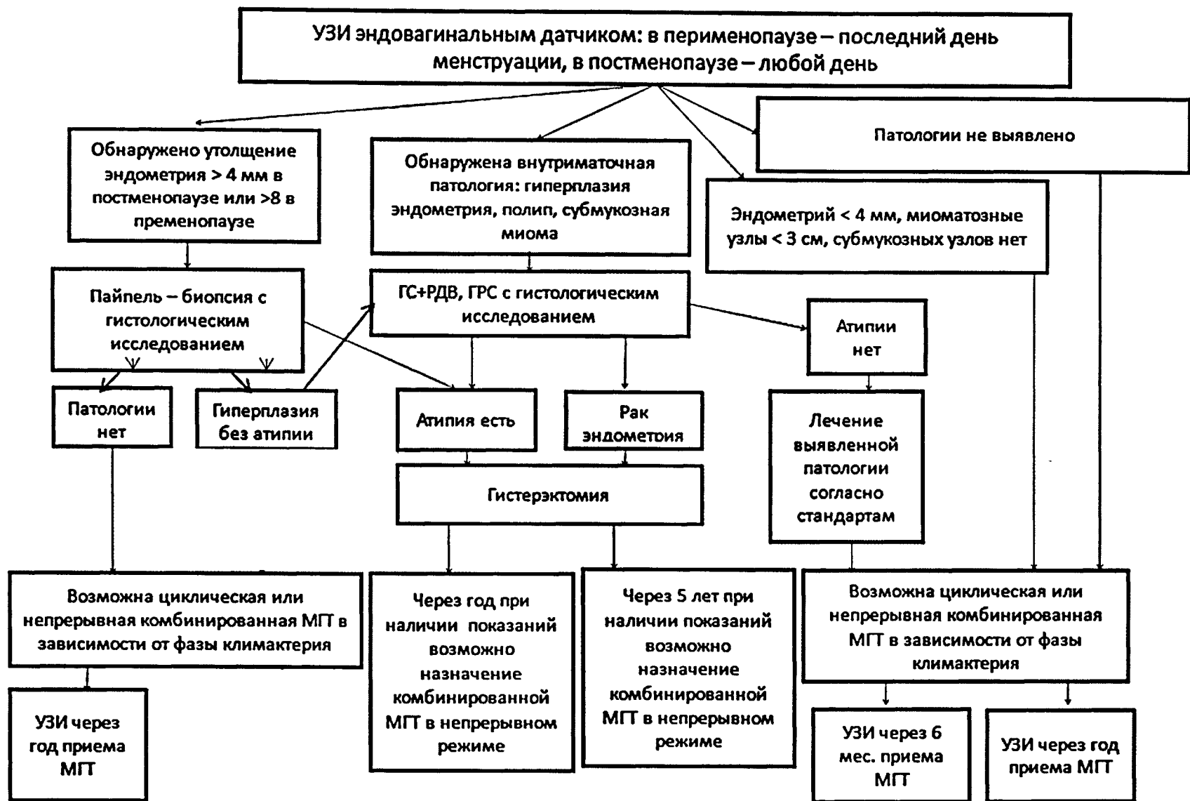
Рисунок 3. Контроль эндо- и миометрия перед назначением МГТ