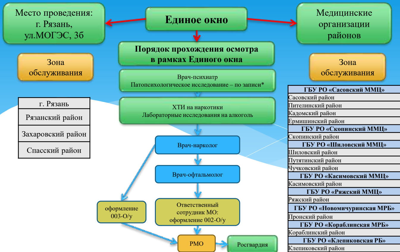
Схема получения разрешения на владение оружием в Рязанской области в 2 этапа